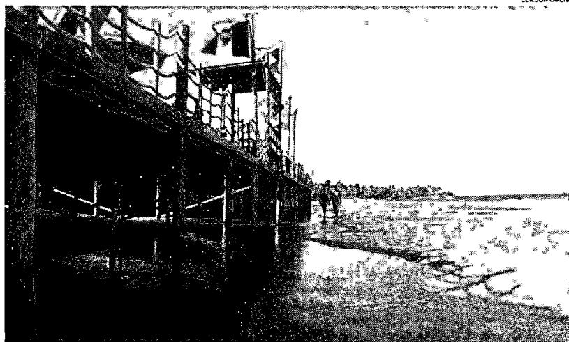
Deque do restaurante localizado em Ipioca teve licença “questionável” concedida pelo IMA e só pode ser demolido por decisão judicial

Posteriormente, em audiência realizada em novem-